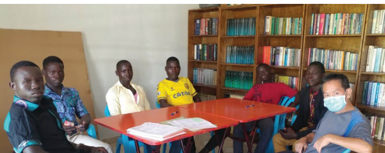
在Pakwach辦公室及教牧資源中心(圖書館)